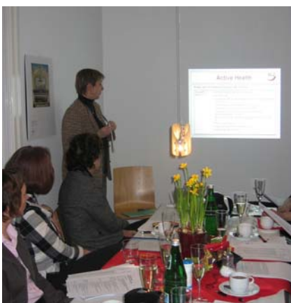
Kick-Off-Meeting des Projekts in den Räumen der BGZ

„Active Health“ will durch Sensibilisierung und Empowerment einen Beitrag zur europäischen Sozialschutzstrategie leisten und Wege zu einem besseren Gesundheitsschutz für MigrantInnen aufzeigen. Unter anderem sollen mehr BürgerInnen mit Migrationshintergrund dafür gewonnen werden, Berufe im Gesundheitswesen zu ergreifen.