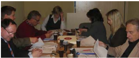
2. Transnationales Treffen - diesmal in Warschau

Im November startete ein neues Leonardo-Pilotprojekt der BGZ: Trialog will den Spracherwerb von Polnisch, Türkisch und Deutsch als Fremdsprache fördern. Durch den Erwerb von weniger verbreiteten Sprachen können Jugendliche ihre Chancen auf dem europäischen Arbeitsmarkt steigern. Das Projekt, das von der Senatsverwaltung für Wirtschaft und Frauen getragen wird, läuft bis 2008. Beteiligt sind Partner aus Deutschland, Polen und der Türkei.