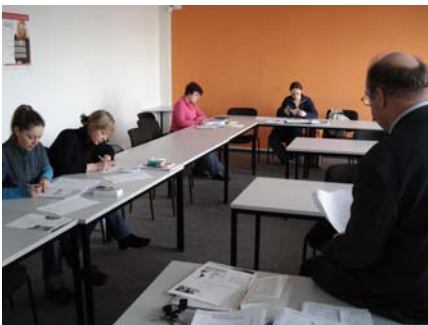
Seminar im Rahmen des Praxistrainee-Programms in den Räumen des Seminarzentrum Göttingen

Ein zwölfmonatiges Praxistrainee-Programm speziell für hoch qualifizierte Aussiedlerinnen und Migrantinnen aus Osteuropa bietet das Seminarzentrum Göttingen im Rahmen der durch die BGZ koordinierten EQUAL-Entwicklungspartnerschaft Prointegration an. Partner sind kleine und mittlere Unternehmen in Berlin. Ziel des Projekts ist, Teilnehmerinnen eine dauerhafte Beschäftigung zu vermitteln. Die bisherige Bilanz kann sich sehen lassen: Viele erhielten feste Arbeitsverträge – teils sogar schon vor Beendigung der Traineeephase.