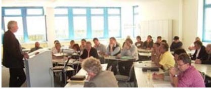
Die gemeinsame Zertifizierung mit den Partnerländern sorgt für viel Gesprächsstoff

Grenzüberschreitende Zusammenarbeit wird in der europäischen Bauwirtschaft zur Regel. Um Fachkräfte mit den veränderten Qualitätsstandards vertraut zu machen, haben die TeilnehmerInnen des EU-Pilotprojekts „Umbau und Ko“ Module für Zusatzqualifikationen in der Aus- und Weiterbildung sowie Möglichkeiten zu deren Zertifizierung entwickelt.