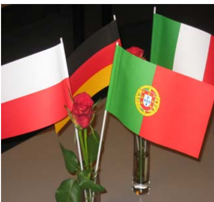
Die Partnerländer im Projekt