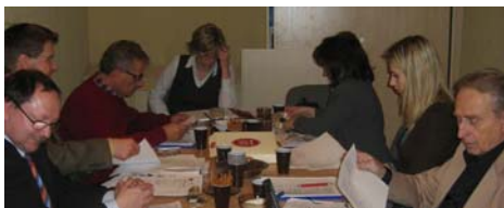
2. Transnationales Treffen - diesmal in Warschau.

Im November startete ein neues Leonardo-Pilotprojekt der BGZ: Trialog will den Spracherwerb von Polnisch, Türkisch und Deutsch als Fremdsprache fördern. Durch den Erwerb von weniger verbreiteten Sprachen können Jugendliche ihre Chancen auf dem europäischen Arbeitsmarkt steigern. Das Projekt, das von der Senatsverwaltung für Wirtschaft und Frauen getragen wird, läuft bis 2008. Beteiligt sind Partner aus Deutschland, Polen und der Türkei.