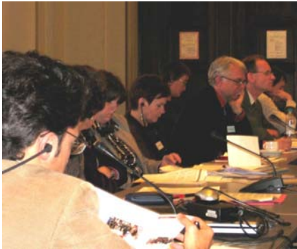
lebhaftes Diskussion während der Konferenz

In Zeiten der Globalisierung wandern auch aus EU-Ländern immer mehr AkademikerInnen ab. Umso wichtiger wird es, hoch qualifizierte MigrantInnen besser in diese Arbeitsmärkte zu integrieren. Wie bestehende Integrationshemmnisse auf nationaler und europäischer Ebene abgebaut werden können, wurde vom 16. bis 17. November 2006 auf der Abschlusskonferenz des Projekts „INTI – Erfolg durch Migration“ im Berliner Rathaus diskutiert.