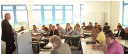
Die gemeinsame Zertifizierung mit den Partnerländern sorgt für viel Gesprächsstoff

Grenzüberschreitende Zusammenarbeit wird in der europäischen Bauwirtschaft zur Regel. Um Fachkräfte mit den veränderten Qualitätsstandards vertraut zu machen, haben die TeilnehmerInnen des EU-Pilotprojekts „Umbau und Ko“ Module für Zusatzqualifikationen in der Aus- und Weiterbildung sowie Möglichkeiten zu deren Zertifizierung entwickelt.